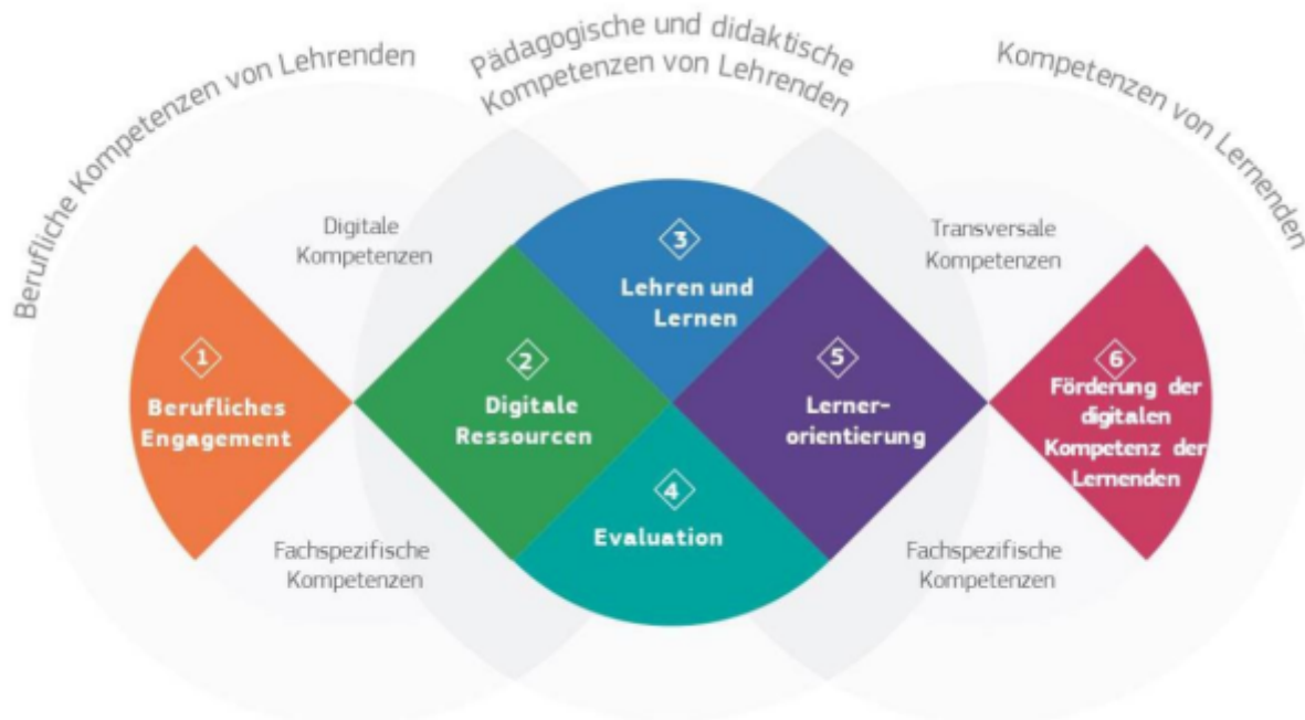
Abbildung 1: Der DigCompEdu Kompetenzrahmen

Die europäische Union hat mit dem DigCompEdu die in allen EU-Ländern verbindlichen Kompetenzen von Lehrkräften in einer zunehmend digitalisierten Gesellschaft beschrieben.